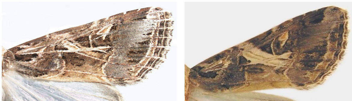
شکل ۱- بال جلویی S. litura (سمت راست)، بال جلویی S. littoralis (سمت چپ)

بیشترین میزان شکار توسط تله طعمه گذاری شده با فرمون جنسی S. exigua با میانگین روزانه ۶/۵۸ شب پره نر S. exigua و کمترین میزان شکار توسط تله طعمه گذاری شده با فرمون جنسی S. littoralis با میانگین روزانه ۲/۷۴ شب پره نر به ثبت رسید.