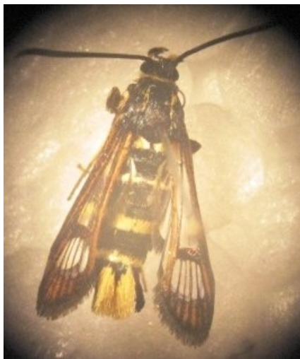
شکل ۴- حشره کامل S. caucasica Figure 4- The adult of S. caucasica