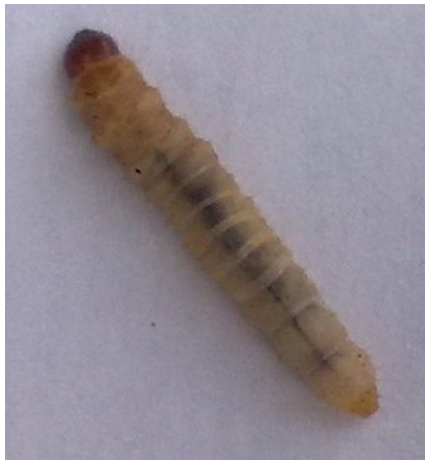
شکل ۲- لارو سن سوم S. caucasica Figure 2- The 3 rd instar larva of S. caucasica