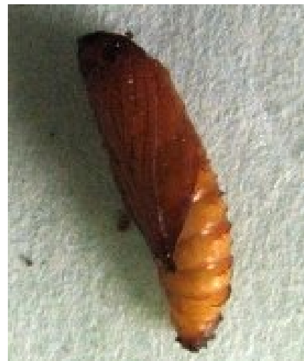
شکل ۳- شفیره S. caucasica Figure 3- The pupa of S. caucasica