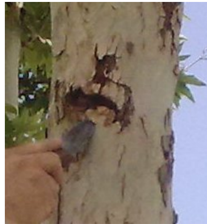
شکل ۱- خسارت S. caucasica روی درخت چنار Figure 1- The damage caused by S. caucasica on plane trees